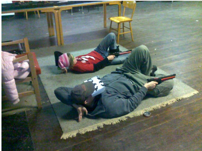
Arkivbilde fra 28.02.2010 Eidsvoll

Årets første utendørsskyting ble arrangert av Notodden Pistolklubb.