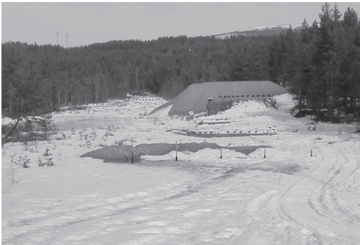
Bolkesjø-banen i "påskevær"

For første gang på svært mange år, skulle vi igjen ha stevne på vinterstid. Som arrangør var vi nok noe usikre på om været skulle holde. Det kunne være alt fra bare snøslaps til 1,5 meter snø om vi var uheldige. Vi så også for oss at det kunne være problem med oppsett av dyra reint tidsmessig.