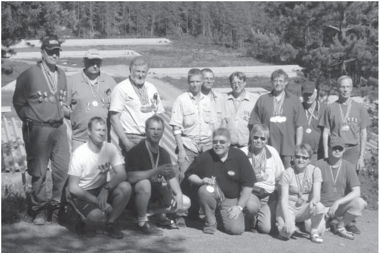
De fleste av medaljevinnerne under Nordisk-2007 for MS-pistol.

INFORMASJONSORGAN FOR NORGES METALLSILHUETTFORBUND