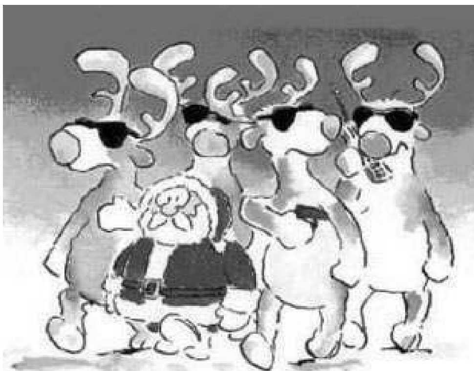
Julenissen på vei tilbake til Nordpolen

Søknad sendes som E-post til egilh@email.com