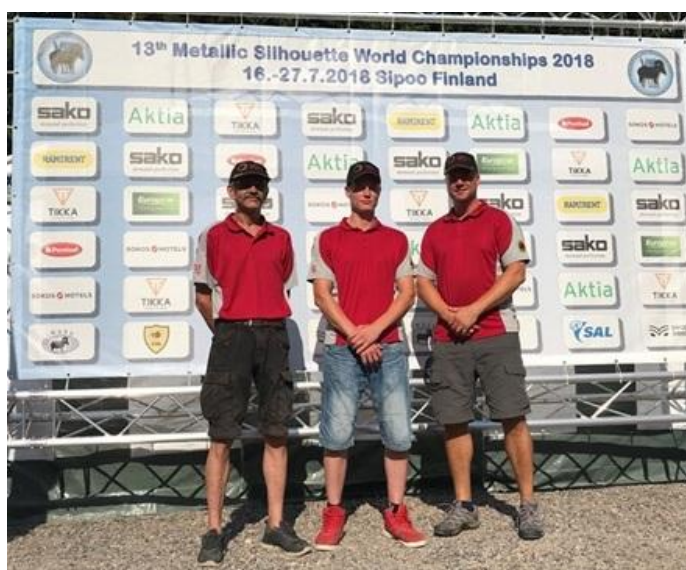
VM 2018 Sippo