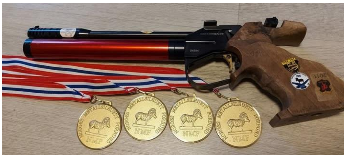
Denne pistolen har enorm appetitt på gullmedalder.